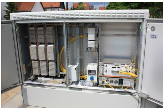
Moderne Technik für die Datenautobahnen, gefördert durch ELER und EFRE.

Der Europäische Landwirtschaftsfonds für die Entwicklung des ländlichen Raums (ELER) und der Europäische Fonds für regionale Entwicklung (EFRE) bilden die zentralen Säulen der Förderung des Breitbandausbaus in Sachsen-Anhalt. Land und Kommunen sorgen mit Hilfe der großzügigen EU-Mittel für neue Datenautobahnen.